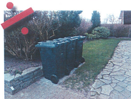
Her er det næsten i orden, men der skal lægges en stribe fliser mere, så skraldemanden ikke skal trække beholderen over græsset