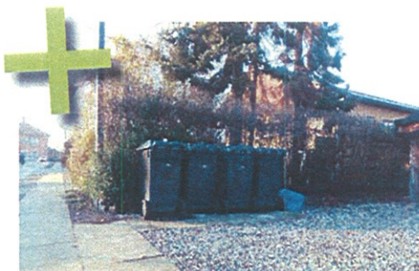
Her er der lavet en plads med fliser i perlegruset