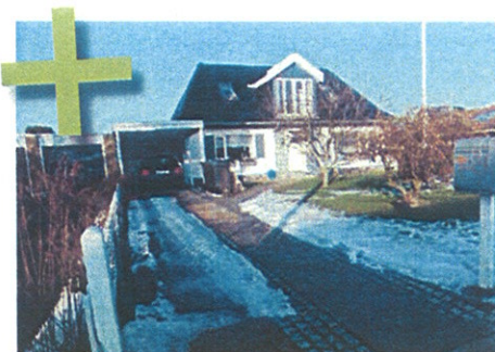
Praktisk placering på borgers vej til bilen