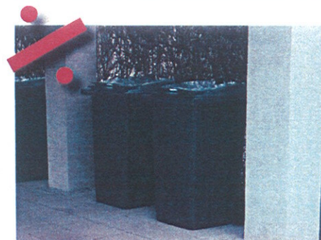
Belægningen er fin, men håndtag og hjul på alle tre beholdere vender den forkerte vej (væk fra skraldemanden)