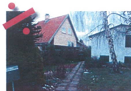
Disse fliser er ikke et jævnt underlag