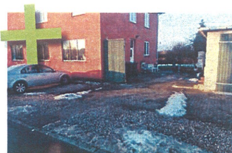
Her har borgeren lagt fliser igennem de løse sten for at lave en god adgangsvej for skraldemanden