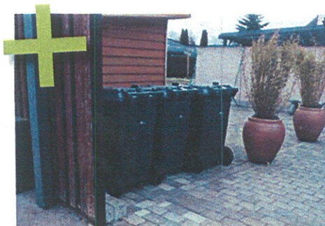
Også her har borgeren anlagt en standplads og kørevej med fast underlag