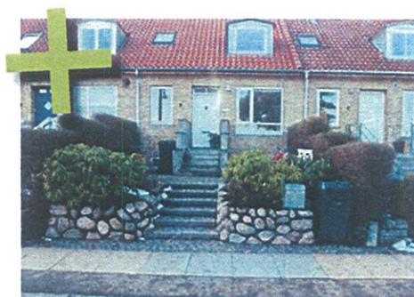
Her er der problemer pga. trappen. Beboerne har valgt en enkelt standplads ved fortovet, hvor de stiller beholderen ned, når den skal tømmes